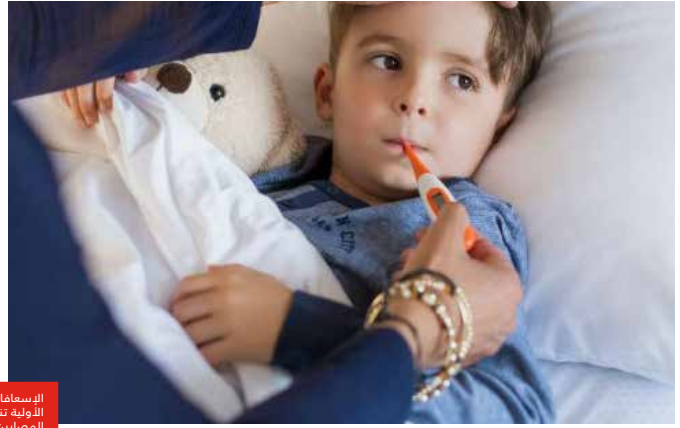
الإسعافات الأولية تنقذ المصابين من التسمم ولدغات الحشرات