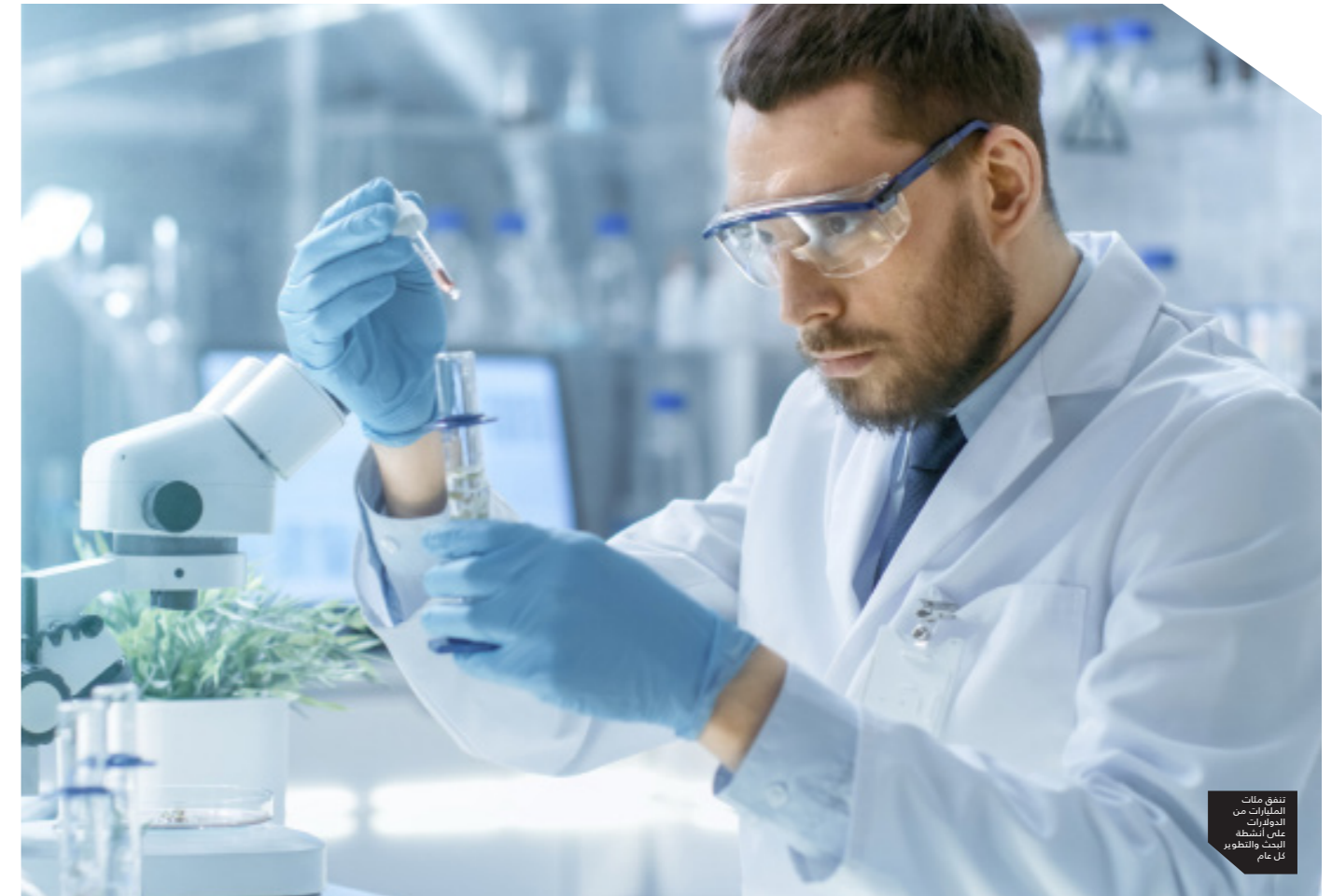
تنطق مئات المليارات من الدولارات على أنشطة البحث والتطوير كل عام

غرب أفريقيا عام 2014م، الذي خلف أكثر من 11000 متوفى، النقص الفاجح للاستثمارات في المنتجات والافتقار إلى النهج اللازمة لانتقاء العوامل الممرضة ذات الإمكانيات الوبائية وتقليل تأثيرها إلى أدنى مستوى ممكن. وتثير الفجوات التي تشوب استثمارات في الطريق لعمليات البحث والتطوير الخاصة بالأدوية المضادة للميكروبات قلقاً عالمياً في سياق التزايد السريع لمقاومة مضادات الميكروبات. وقد حدد المرصد العالمي المعني بالبحث والتطوير في مجال الصحة فجوات وتفاوتات بارزة في الاستثمار بين البلدان من ناحية وبين القضايا الصحية من ناحية أخرى، مع تواتر حالات الانفصال بين عبء المرض ومستوى النشاط البحثي. ■ البلدان المرتفعة الدخل لديها عدد من الباحثين في مجال الصحة يفوق بـ 40 ضعفاً في المتوسط ما تملكه البلدان المنخفضة الدخل. وذلك بناءً على بيانات مأخوذة من 60 بلداً.