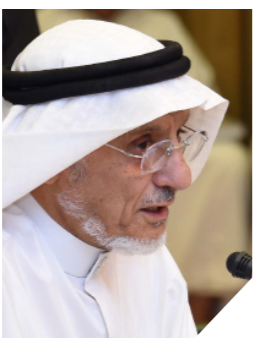
المملكة هي العضو ال 91 في الاتحاد الدولي لجمعيات الصليب والهلال الأحمر

واستقطبت الجمعية كواد اعلامية مميزة في شتى المجالات الاعلامية للعمل فيها، وعملت على نشر أخبار وأنشطة