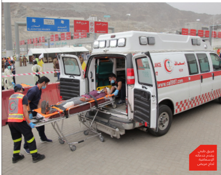
فرق طبي يقدم خدمات الإسعافية لحجاج مرضى

في ظل الدعم الكبير الذي تتلقاه الهيئة من حكومة خادم الحرمين الشريفين رعاها الله، حققت الفرق الإسعافية لهيئة الهلال الأحمر السعودي نجاحاً كبيراً خلال موسم الحج للعام الحالي 1439هـ، حيث قدمت خدماتها الإسعافية لأكثر من 22.242 حاجاً من ضيوف الرحمن في نطاقات مكة المكرمة والمشاعر المقدسة والمدينة المنورة، ووفرت كافة الإمكانيات الطبية واللوجستية والكوادر البشرية المؤهلة لتقديم أرقى الخدمات الطبية لحجاج بيت الله الحرام.