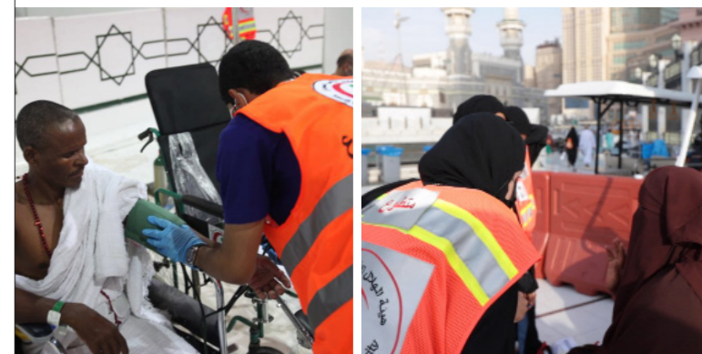
فرق إسعافية تستعد بمعداتهما المنظورة في موسم الحج