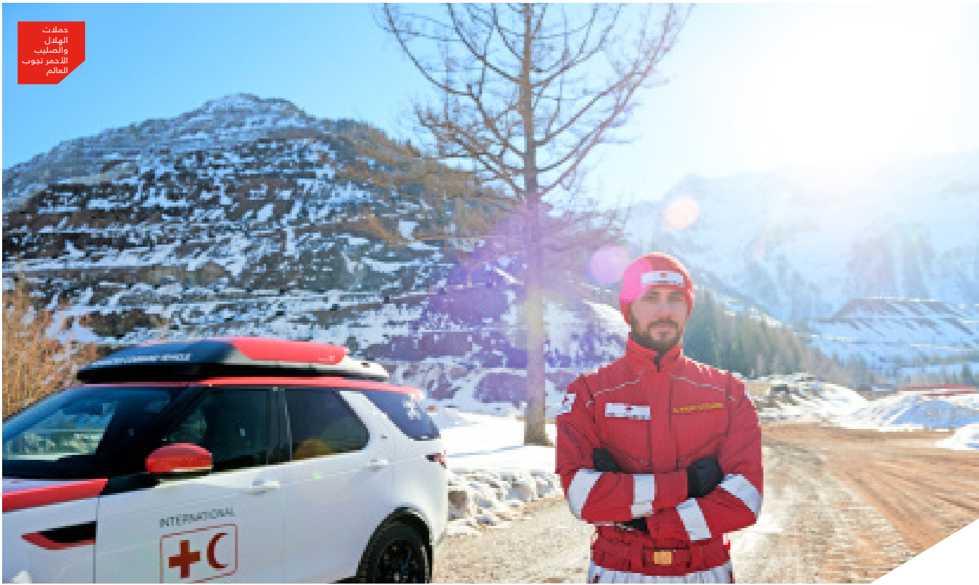
حملات الهلال والصليب الأحمر جنوب العالم

قرشاً واحداً من مبلغ الجائزة الكبير، بل أوصى به إلى الجمعيات الخيرية في سويسرا وأوروبا وسدد بعضاً من ديونه الكبيرة، وظل في الغرفة رقم 12 التي عاش بها بكل بساطة ومات بها؛ تلك الغرفة التي أصبحت اليوم معلماً يقصده السياح للاطلاع على تجربة حياة أحد أهم الرجال عبر التاريخ. لقد ألهم هنري دونانت الرسامين والشعراء والسينمائيين والموسيقيين فجدت شخصيته في السينما واستلهم المسرح من تجربته الكثير من الأعمال، كما سميت باسمه المستشفيات والمدارس والشوارع. وتكريماً له قام الرئيس السويسري "ديديه بورخالتر" عام 2014م بتسمية ثاني أعلى قمة في سويسرا إلى قمة دونانت.