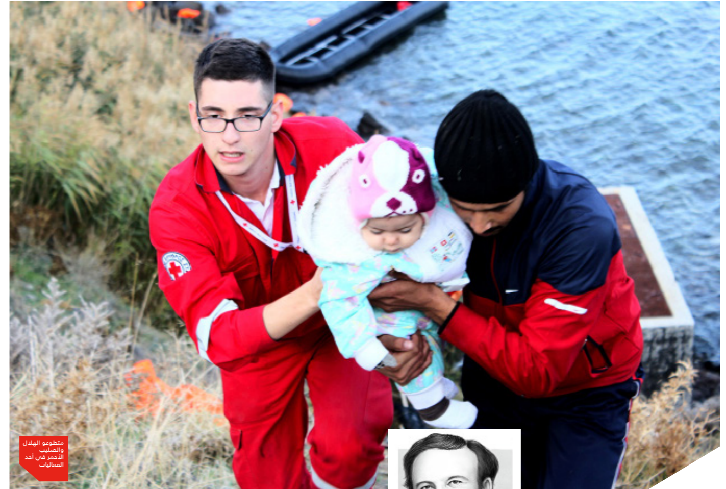
متطوعو الهلال والصليب الأحمر في أحد المعاليم