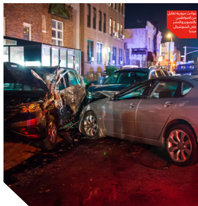
حوادث مرورية تفعل من المواطنين بالتصوير والنشر على السوشال ميديا

بعض الحالات والحوادث تتطلب تصوير لقطات معينة وأشياء محددة من قلب الحادث دون التعرض لوجوه المصابين وأجسادهم، فمثلاً يمكن تصوير الهويات الشخصية أو رخصة القيادة، وحتى تصوير تلك الأشياء هي في غالب الأحيان من اختصاص الصحفيين والعاملين في الإعلام. ■